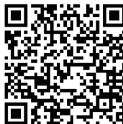
お打ち合わせフォーム