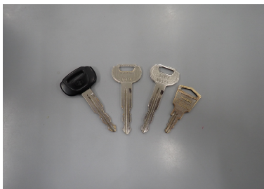
鍵 1 式