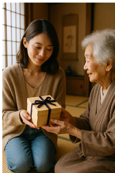
春日部の桐箱をテーマに AI で生成した画像