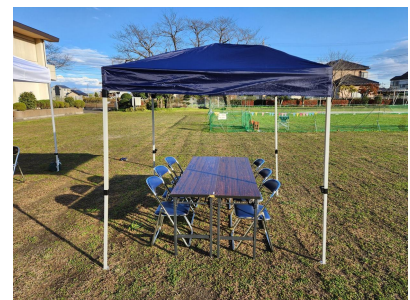
ファミリーシート(イメージ)