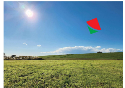
ファミリーシート(上流)からの 景色(イメージ)