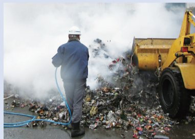
リチウムイオン電池による火災の様子

リチウムイオン電池は、破損や変形などの強い衝撃が加わると、発熱・発火の恐れがあります。