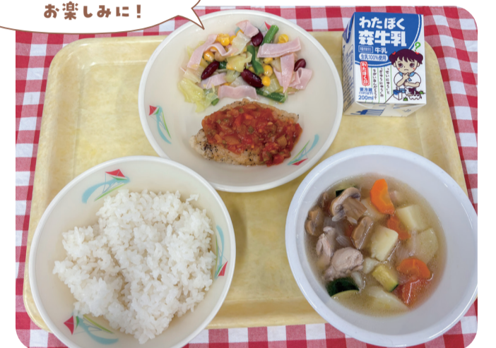
FIFA ワールドカップ応援給食の献立 「ごはん、牛乳、白身魚のサルサソース、コーンと豆のサラダ、カルド・デ・ポジョ(鶏肉のスープ)」