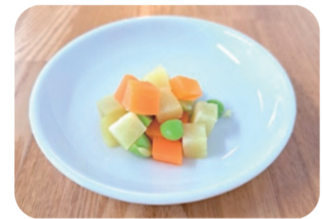
離乳食「枝豆入りコロコロポテトサラダ」