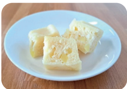
手作りおやつ「おからの蒸しパン」