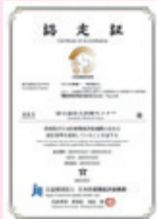
▲病院機能評価の認定証