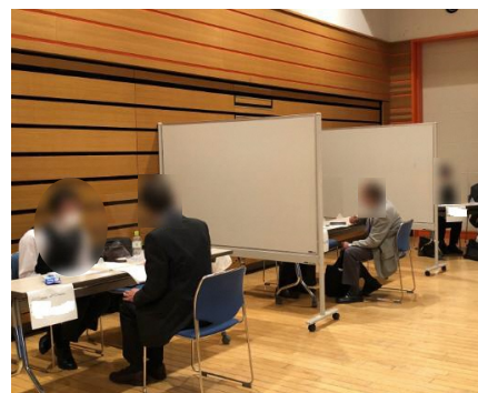
※合同企業面接会の様子

コーエイ・デライト株式会社 株式会社ジャンプ 株式会社外林 株式会社日本デイクアセンター 株式会社東日本福祉経営サービス 株式会社マルゼン 丸天運送株式会社 株式会社流通サービス ワタキューセイモア株式会社