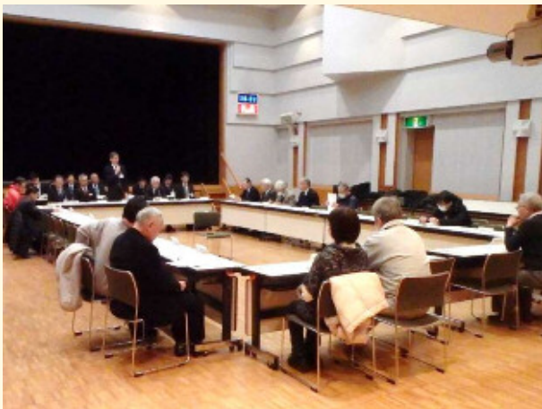
お忙しいなか、多くの皆様にお集まりいただきました。