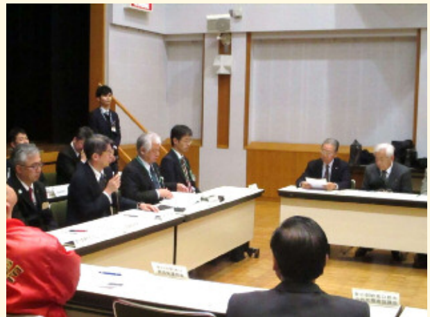
さまざまな質疑応答が交わされました。